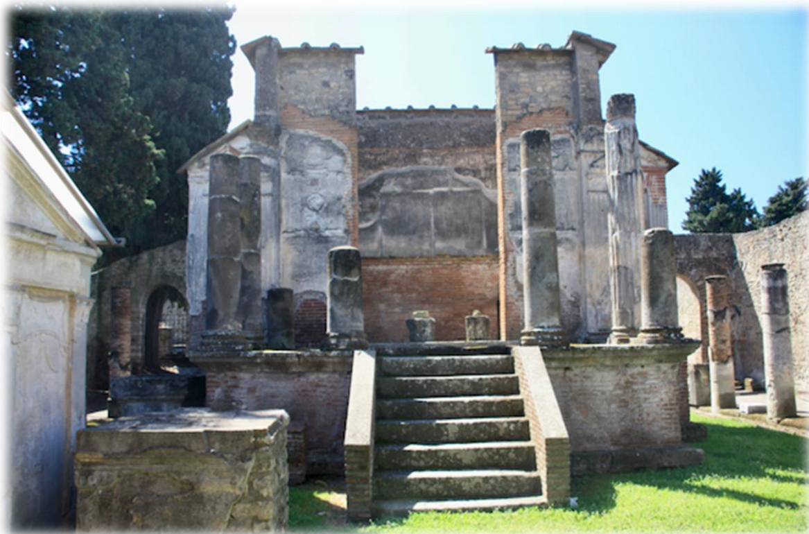
Templo de Isis