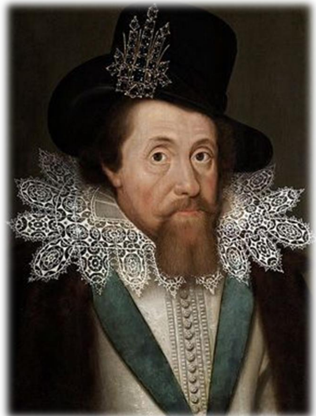
Rey Jacobo I 1566-1625