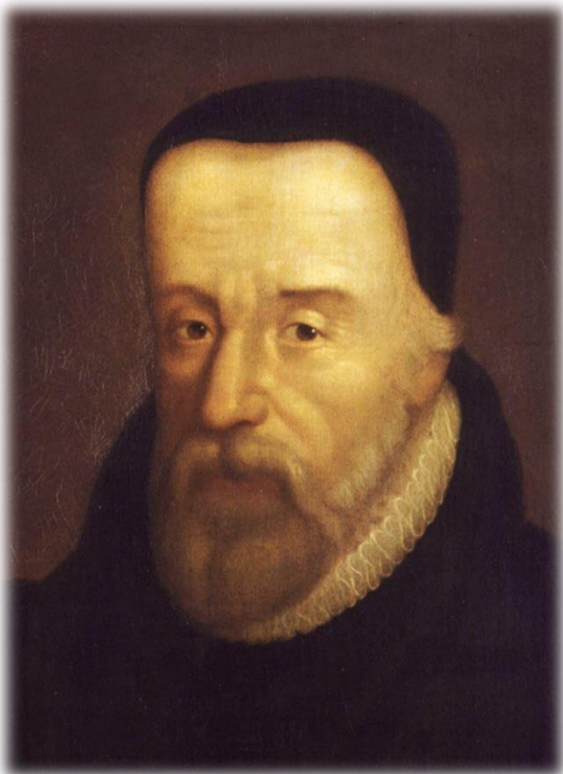
William Tyndale 1494-1536

διὰ τοῦτο δώσει κύριος αὐτὸς ὑμῖν σημεῖον ἰδοὺ ἡ παρθένος ἐν γαστρὶ ἔξει καὶ τέξεται υἱόν καὶ καλέσεις τὸ ὄνομα αὐτοῦ Εμμανουηλ