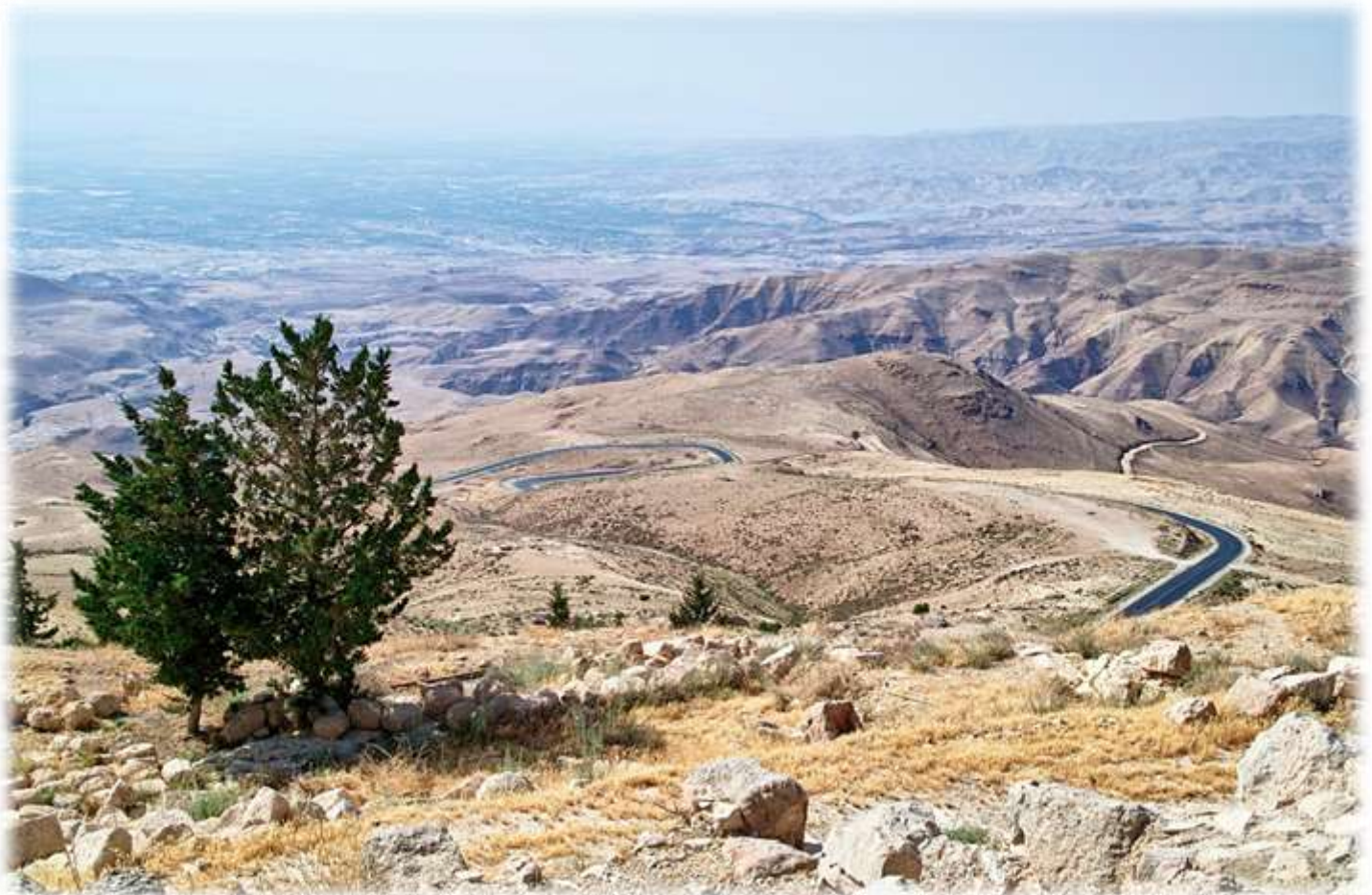
Monte Nebo (Jordán)